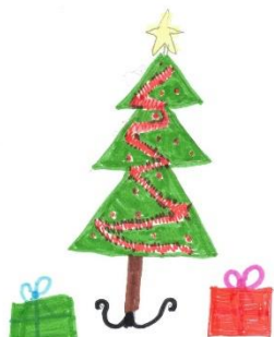
Kristýna Baktová 4. třída

Na Vánoce jsem šla. Těším se na to, že budu doma s rodinou. Vánoce jsou 24. prosince a šlo na květi. Ke škole máme šaly Vánoce. Něhlo si vyložíme hodinky a kam se jme do školy přineseme úřky a rozkládáme si je. Přijdu 24. 1. prosince dostanu, kalendář a školní knihu. V prosinci dostávám na školě dopis. Na Vánoce si přiji: oblečení, knížky a sladkosti. 24. prosince jsou Vánoce, 6:00 se jdeme navštěvat, máme říčky se salátem. Po večeři jdu do postele, 5 minut počkám a jdu se pokoušet do obzračho. Budu sam, když a oblečení. Moc se na Vánoce těším. 😊